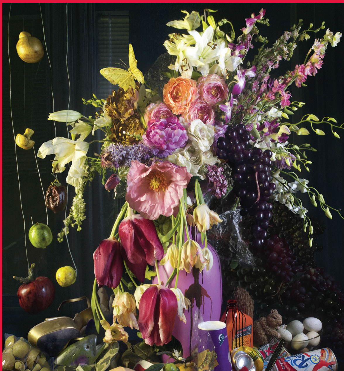
David LaChapelle - Earth Laughs In Flowers