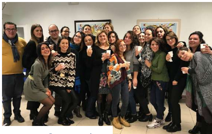
Inaugurazione Anno Formativo 2020