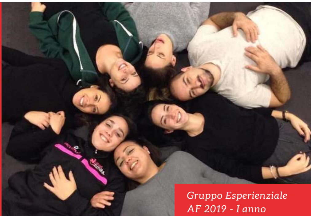
Gruppo Esperienziale AF 2019 - I anno